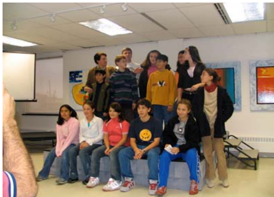
Alumnos del Curso de Historia de México

Las más de tres horas que duró la fiesta pasaron volando, ya que la alegría fue mucha, y la convivencia de profesores de la ESECA con estudiantes y amistades en este marco de celebración mexicana fue muy agradable y cordial.